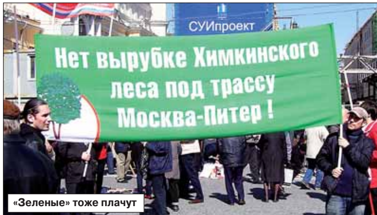
«Зеленые» тоже плачут