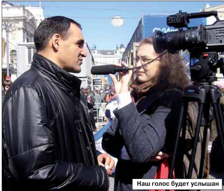
Наш голос будет услышан

мики, строго выполнять все требования трудового и миграционного законодательства, проявлять свои лучшие качества, защищать свои трудовые и социальные права законными,