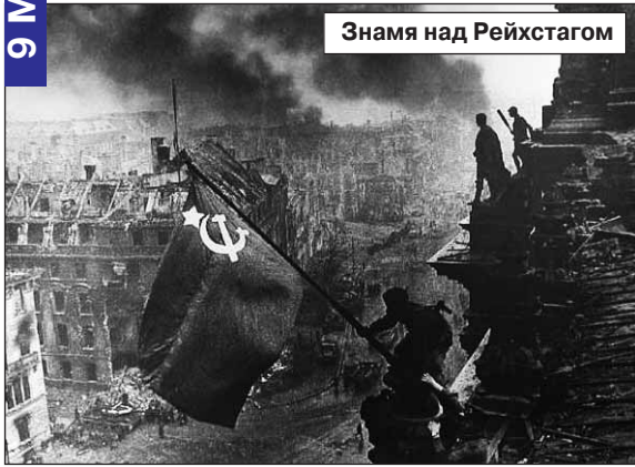
Знамя над Рейхстагом