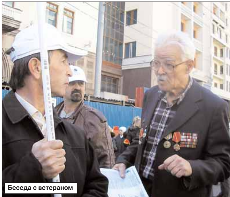
Беседа с ветераном