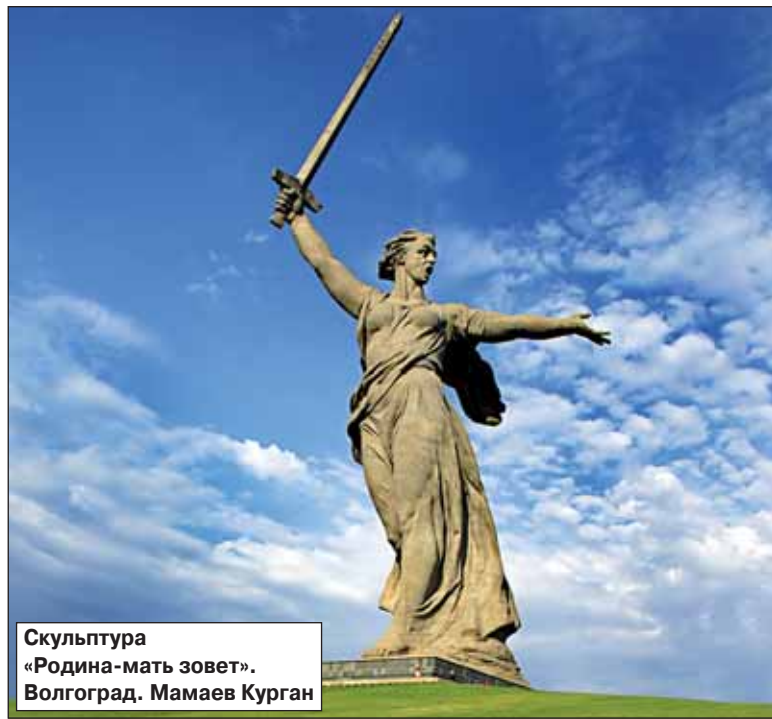
Скульптура «Родина-мать зовет». Волгоград. Мамаев Курган

Редакция газеты «Вести трудовой миграции»