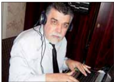
64-я годовщина Великой Победы