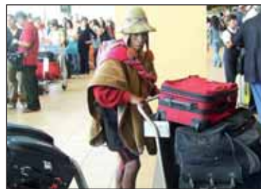
Информация к размышлению