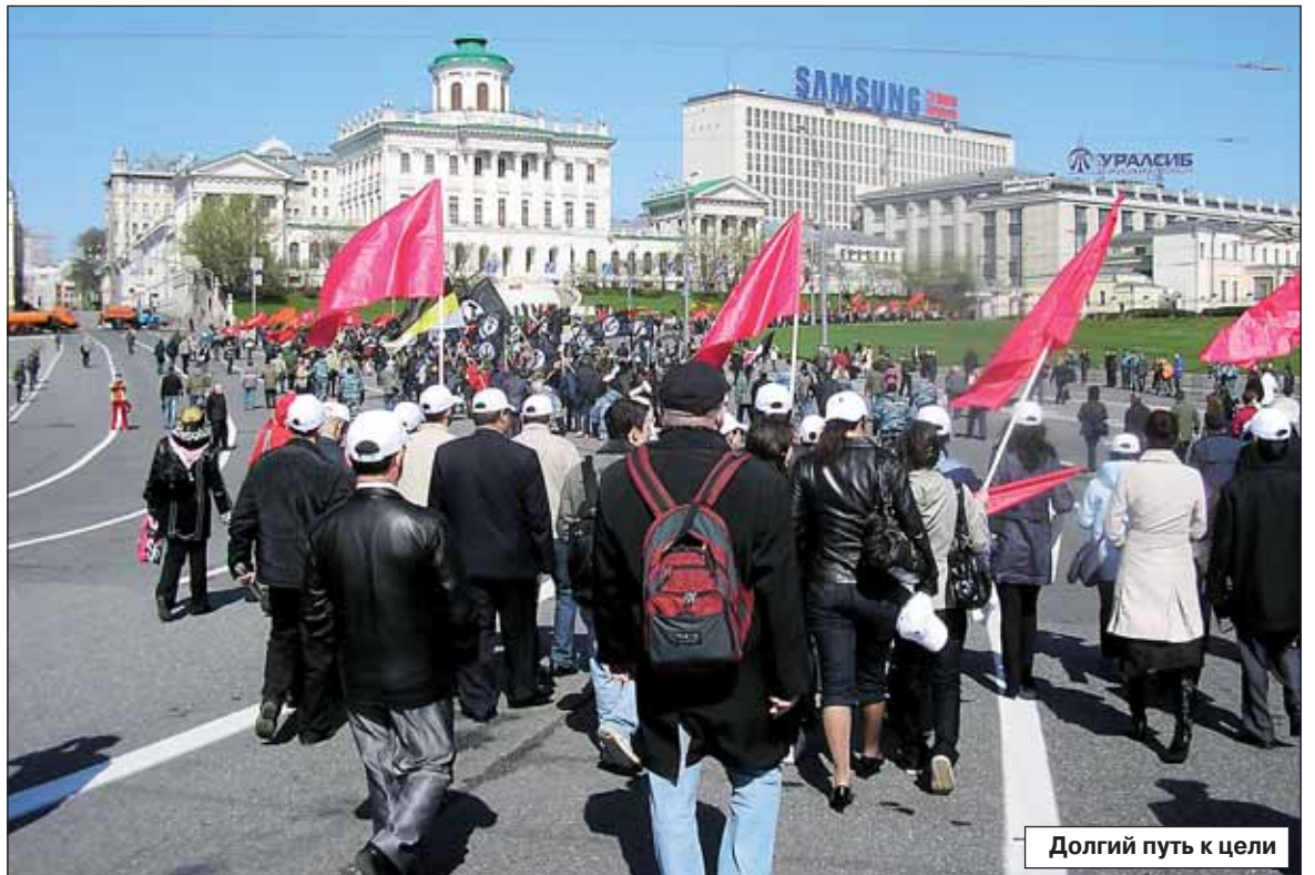
Долгий путь к цели