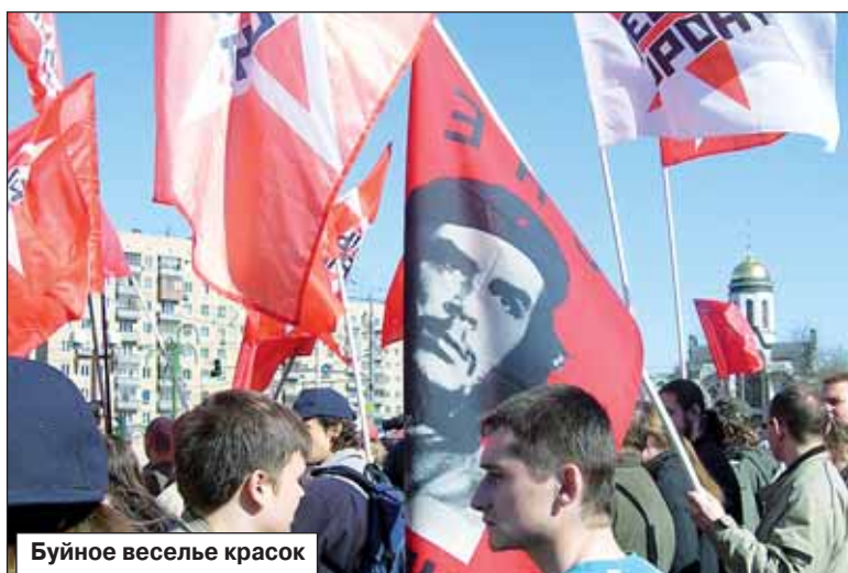
Буйное веселье красок