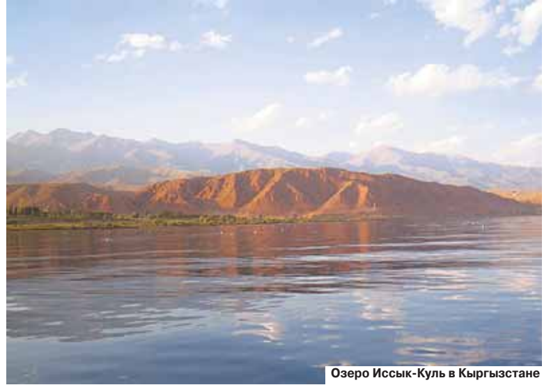
Озеро Иссык-Куль в Кыргызстане