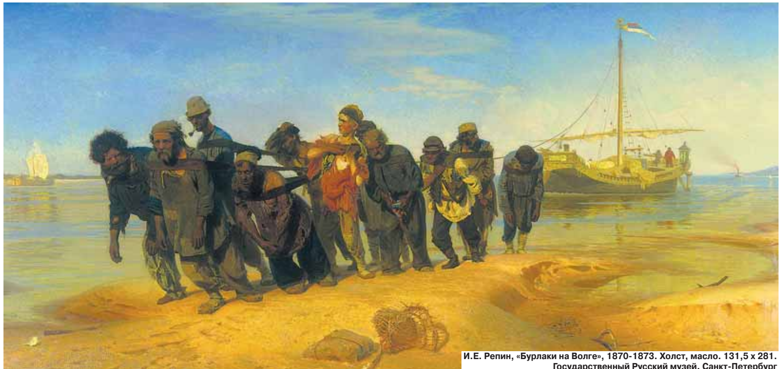
И.Е. Репин, «Бурлаки на Волге», 1870-1873. Холст, масло. 131,5 x 281. Государственный Русский музей, Санкт-Петербург

Гражданин России и Таджикистана, член Профсоюза трудящихся-мигрантов, индивидуальный предприниматель, г. Коломна, Московская область