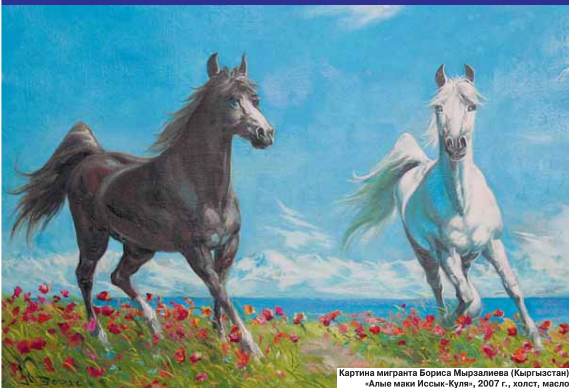
Картина мигранта Бориса Мырзалиева (Кыргызстан) «Алые маки Иссык-Куля», 2007 г., холст, масло

— Ты понял, Николас? Я тебе более ли менее понятно рассказал?